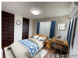
家具・家電等はCGです