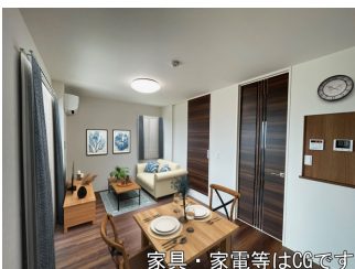
家具・家電等はCGです