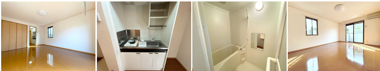
リビング 1口コンロ付きシステムキッチン ユニットバス その他部屋・スペース