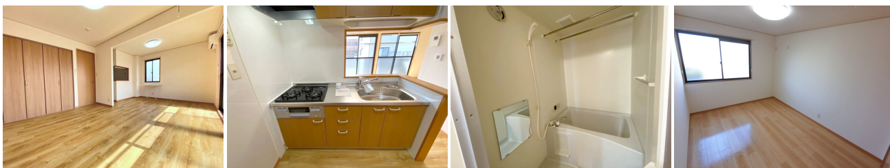
リビング 3口コンロ付きシステムキッチン ユニットバス その他部屋・スペース