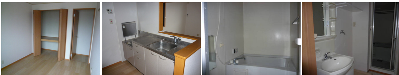
北洋室 クローゼット キッチン B201 浴室 追焚付き B201 洗面所