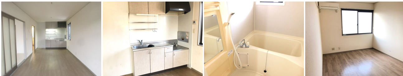
リビング キッチン ユニットバスです その他部屋・スペース