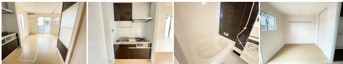
居室・リビング 2口2口付きシステムキッチンです。 浴室換気乾燥機付きの浴槽です。 洋室